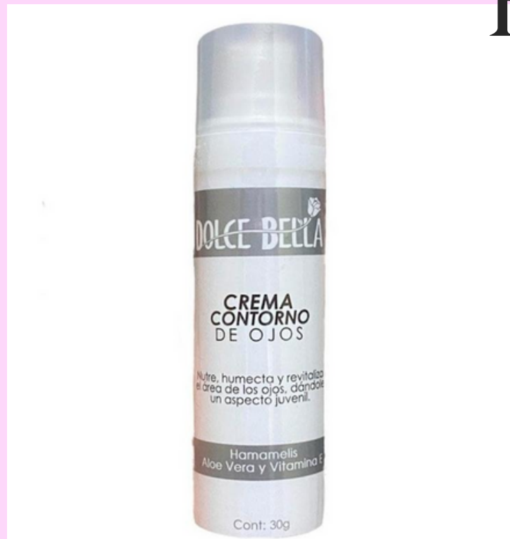
Crema facial Contorno de ojos-Dolce Bella

Es un producto especialmente diseñado para el cuidado del área del contorno de ojos, que la nutre, humecta y revitaliza, es de rápida absorción, contiene vitamina E, hamamelis y aloe vera. Recordemos que esta zona del rostro es un área que forma parte fundamental de nuestra expresividad y es muy propensa a manifestar signos de descuido (por el uso constante de maquillaje) y envejecimiento (por la creación de líneas de expresión debido a la constante gesticulación del rostro)