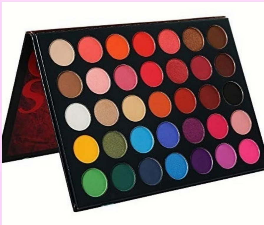
Color Studio-Beauty Glazed

Esta es una paleta de calidad y pigmentacion PROFESIONAL, incluye tonos mattes y satinados de alta pigmentacion, muy faciles de difuminar con una gama muy amplia de tonos.