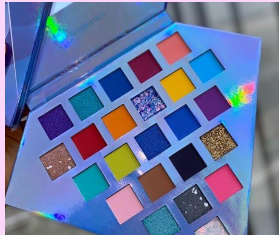
Zafiro sobras diamante-Miis Cosmetics

NOTA: «DUPE» significa que es un producto de linea economica que ha sido inspirada en un producto de alta gama. Pero NO es réplica. Son conceptos diferentes.