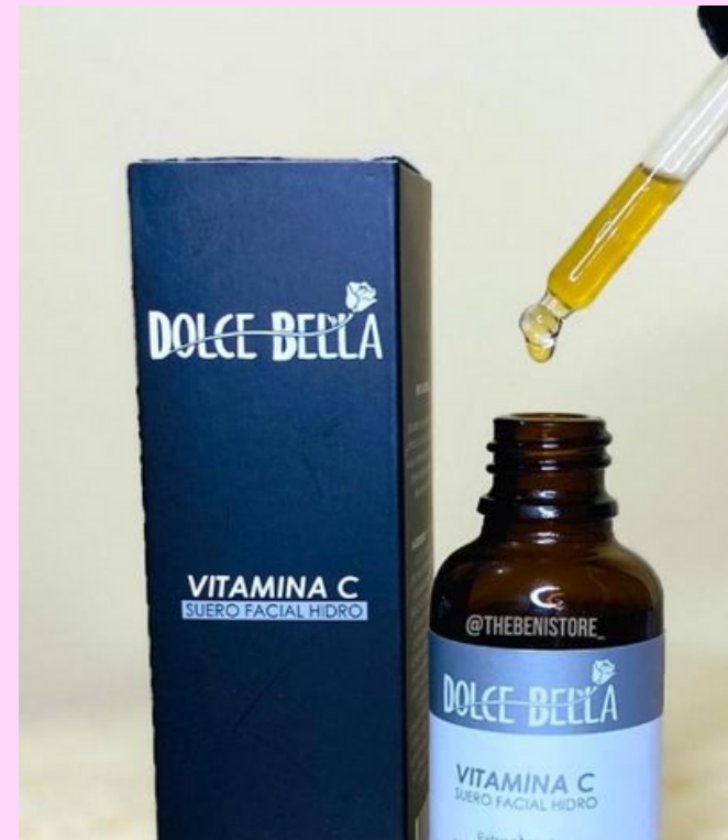
Suero Vitamina C

Es un producto especialmente diseñado para el cuidado del área del contorno de ojos, que la nutre, humecta y revitaliza, es de rápida absorción, contiene vitamina E, hamamelis y aloe vera. Recordemos que esta zona del rostro es un área que forma parte fundamental de nuestra expresividad y es muy propensa a manifestar signos de descuido (por el uso constante de maquillaje) y envejecimiento (por la creación de líneas de expresión debido a la constante gesticulación del rostro)