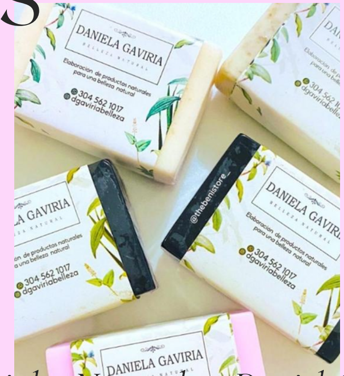
Jabones faciales Naturales -Daniel Gaviria

Este serum facial formulado con vitamina C es un potente agente antioxidante, que protege las células contra los radicales libres generados por los rayos UV que producen daño oxidativo (manchas) importante, esto causa envejecimiento de la piel, provocando la pérdida de agua. Esta vitamina es capaz de neutralizar los radicales. Tiene alto contenido de: aloe vera, extracto de hamamelis y extracto de caléndula que ayudan a reparar la piel del deterioro causado por el maquillaje y exposición al sol